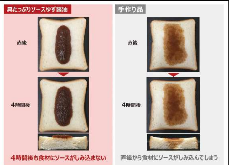
4時間後も食材にソースがしみ込まない