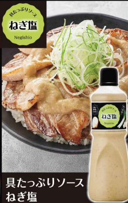
具たっぷりソース ねぎ塩