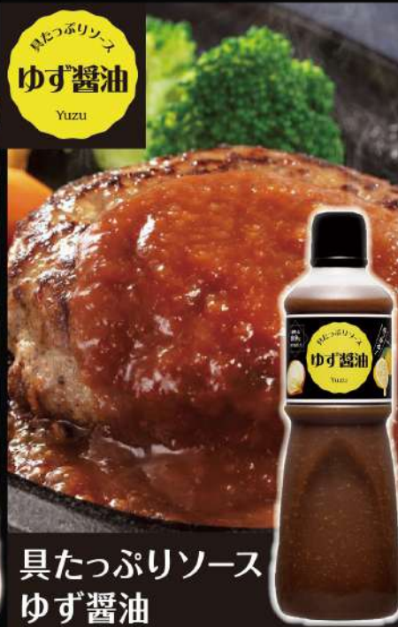
具たっぷりソース ゆず醤油