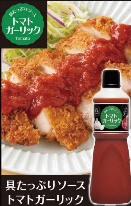
具たっぷりソース トマトガーリック